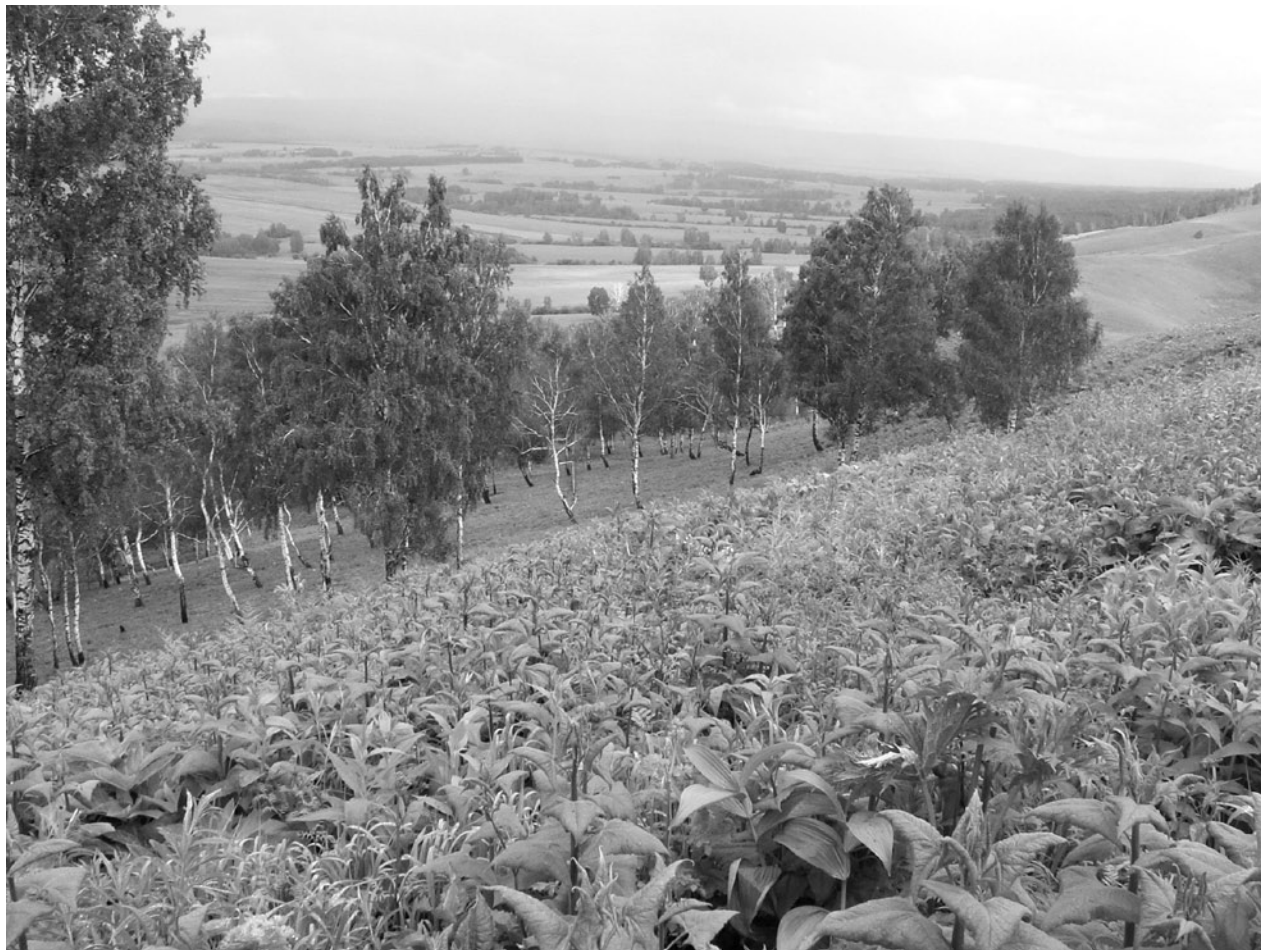
Рис. 1. Сообщества высокотравий с доминированием Cacalia hastata L.

По морфологии сообществ описанные фитоценозы напоминают южно-сибирские высокотравья подпояса черневой тайги или субальпийского пояса гор — сомкнутый высокорослый (до 1.5 м) травостой, хорошо развитая синузия весенних эфемероидов, доминирование крупностебельных и широколистных травянистых многолетников. Кроме того, незначительная роль злаков в сложении травостоя, слабое задернение почвы и фраг-