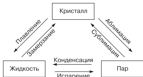
Рис. 1. Процессы, сопровождающие фазовые переходы воды [Рихтер, 1948].

Вместе с тем исследователи, занимающиеся изучением загрязнения Арктики и Субарктики, далеко не всегда в нужной мере учитывают такую двойственность влияния свойств снега, в частности, при формировании аэротехногенного загрязнения снежного покрова. Насколько известно, данные аспекты при изучении загрязнения районов Крайнего Севера ранее в литературе не рассматривались. Цель настоящей работы – раскрыть механизм процесса и установить сопутствующие ему явления.