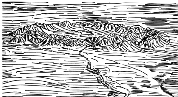
Рис. 3. Северная Австралия. Кольцевой горный массив на месте отпрепарированной астроблемы Тнорада Кратер с возрастом 130 млн лет.

деленной мере и влажных тропиков. В группе гор сезонного развития можно выделить горы муссонного (пассатного) пояса, аридные, гумидные и подчиняющиеся высотной климатической поясности альпинотипные.