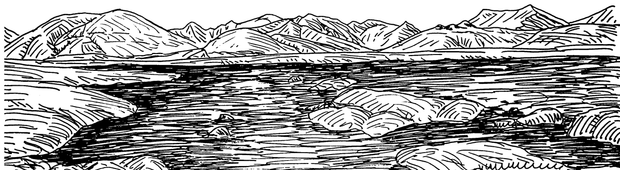
Рис. 4. Западный Тянь-Шань. Высокогорное озеро на сырте Арабель и горы над ним.

Односкатные горы — это уступы, разнообразные по происхождению и морфологии, например надбереговые великие эскарпы восточного склона Большого Водораздельного хребта Австралии или Западные Гаты Индостана. Сюда же относятся северный скат плато Путорана, береговые уступы Скандинавского и Кольского полуостровов. Вообще говоря, односкатные горы наиболее распространены на Земле, поскольку к ним относятся континентальные склоны, борта впадин окраинных и средиземных морей, великие береговые эскарпы типа Большого уступа Южной Африки [17] или берегового уступа Бразилии [18, 19].